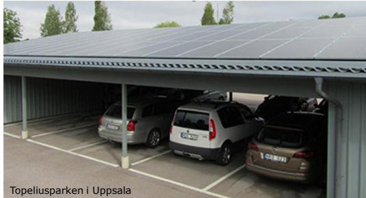
Topeliusparken i Uppsala